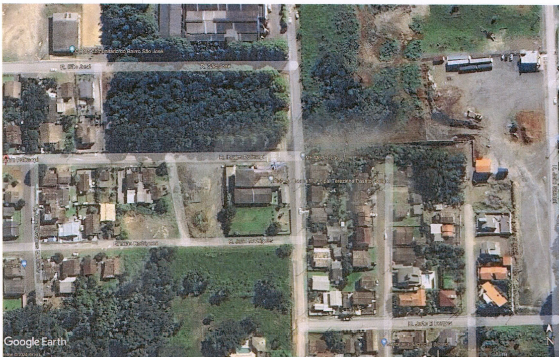
Fig n.º 1 As coordenadas geográficas do referido local são de latitude -28.655412ºde e longitude de -49.466326º

O presente memorial descritivo tem por finalidade, discriminar os materiais e estabelecer as normas para adequação das normas de acessibilidade e reforma No Jardim de Infancia Terezinha Pasetto Spillere, no Municipio de Nova Veneza – SC, localizada na Rua Ibraim Policarpi, no Bairro de Caravaggio.