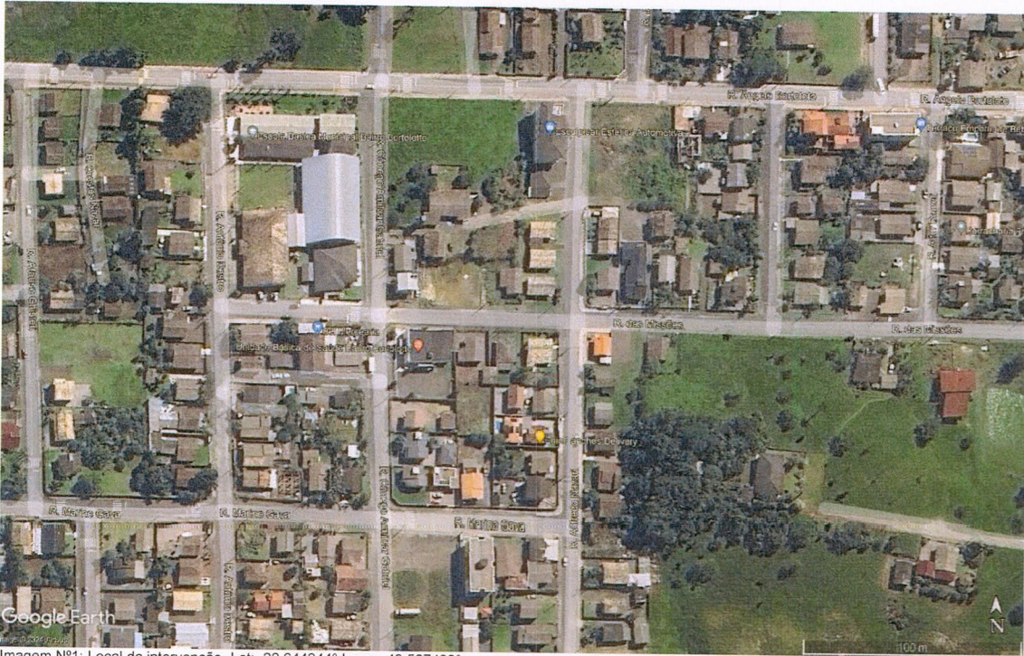
Imagem Nº1: Local da intervenção- Lat: -28.644844° Long: -49.507493°

O presente memorial descritivo tem por finalidade, discriminar os materiais e estabelecer as normas para Substituição do piso no Posto de Saúde do Bairro Bortolotto, no Município de Nova Venéza – SC, localizada na Rua Conego Amilcar Gabriel, nº 115, no Bairro Bortolotto.